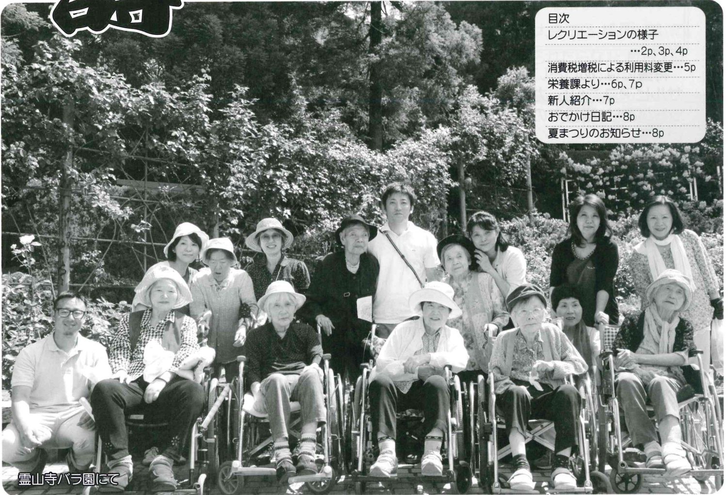
霊山寺バラ園にて